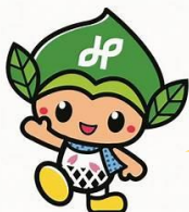
緑区マスコットキャラクターみどりっち